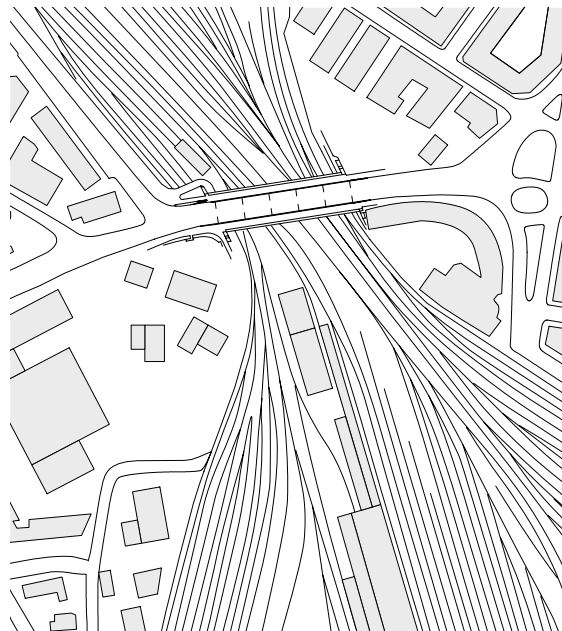
Situation, échelle 1:5 000

Le nouveau pont traverse la voie ferrée de 80 mètres de large sans aucun pilier et forme une élégante courbe légèrement arquée. La structure se compose