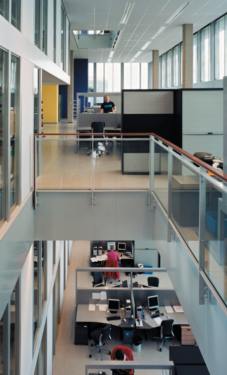
een interieur gekenmerkt door openheid en transparantie, met veel licht en vides voor visueel contact en communicatie